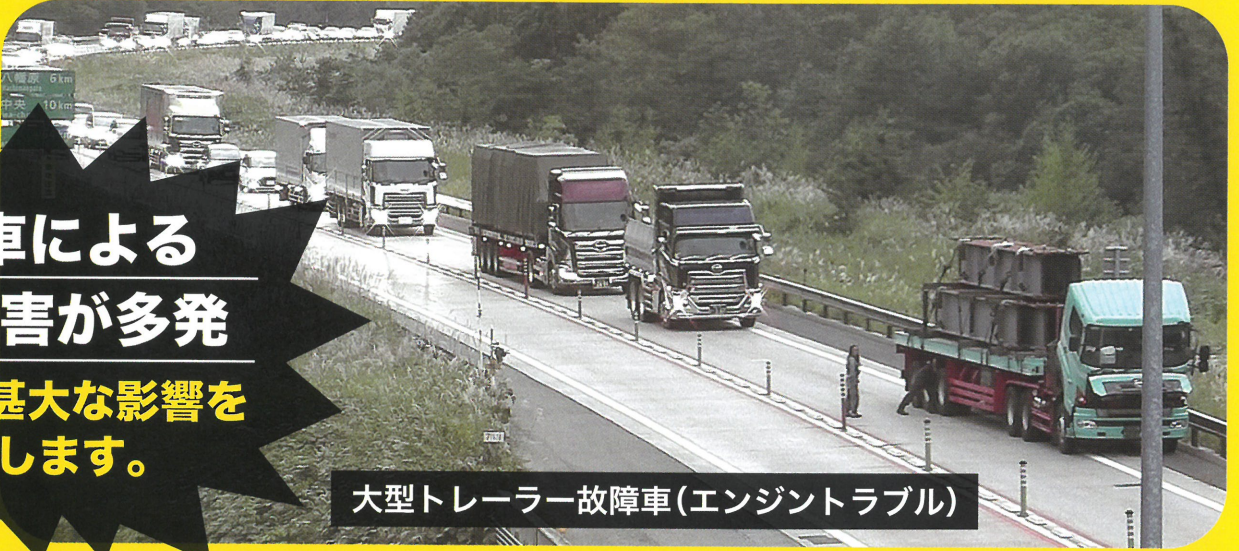
大型トレーラー故障車(エンジントラブル)